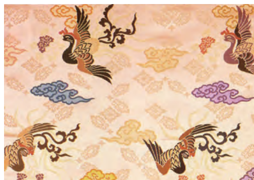
白茶色 散小葵地紋に散雲と 花喰鳳凰模様