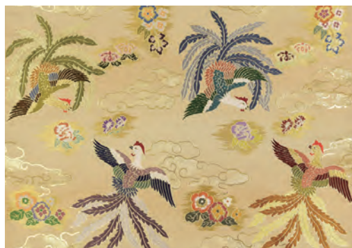
白茶色 霞に散雲華鳳凰模様