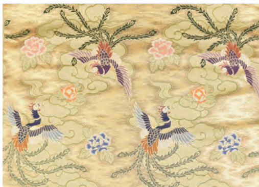
金霞雲地 牡丹に鳳凰模様