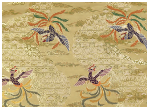
白茶色 道長取鳳凰模様